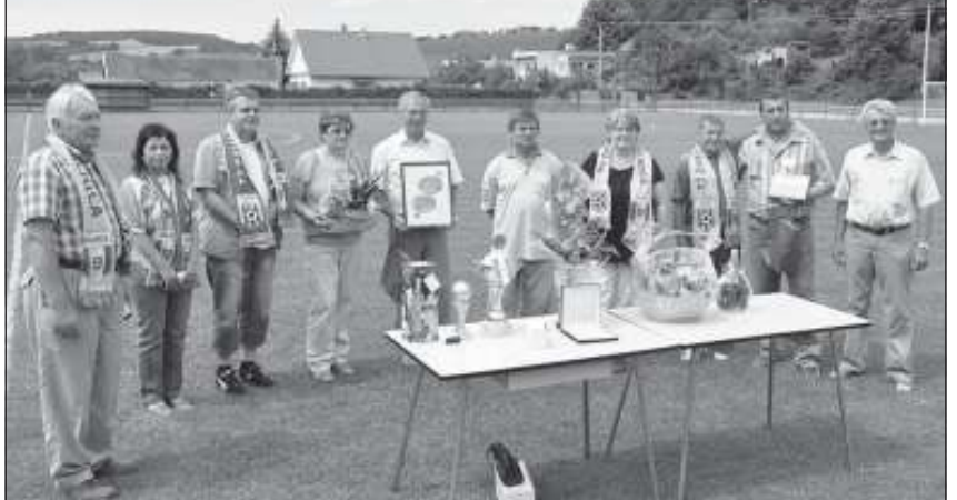
POPOVICE 23.6.2012