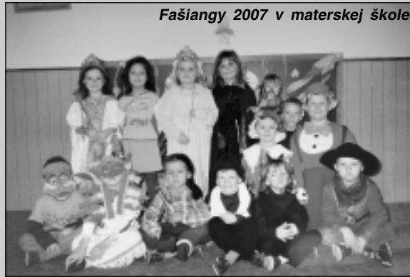
Fašiangy 2007 v materskej škole